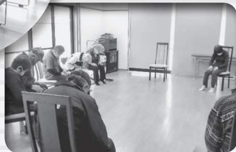
(R5.5.12 南軽井沢地区にて)

現在町内の24地区25カ所で、地域住民が主体となり公民館を活用した健康体操・サロン活動等の「通いの場」が行われています。